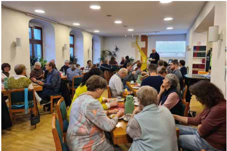
Gemeindeversammlung am 12.11.