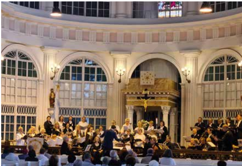
Abschlusskonzert Lößnitzer Musiktage