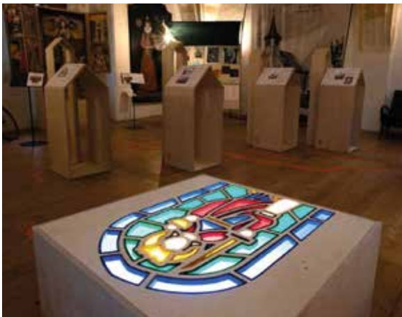
Foto der Ausstellung Madonna auf Wanderschaft

Mittwoch 18:15 - 18:45 Uhr findet ab dann wieder die meditative Andacht statt.