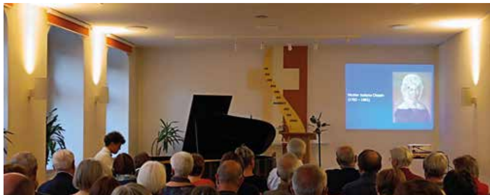
Rückblick Auftaktkonzert Löbnitzer Musiktage 08.05.

19:30 Uhr jeden Mittwoch im Gemein- desaal Affalter, Proben in den Ferien nach Absprache